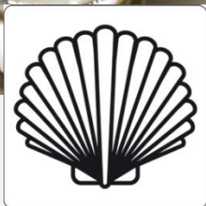
Coquilles St Jacques